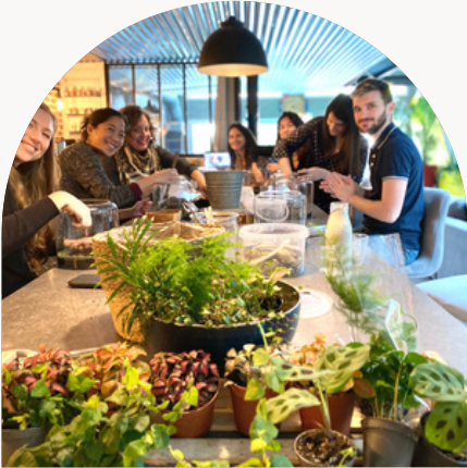
TEAM L'ORÉAL - ÉQUIPE FABRICATION

4 ADJECTIFS & EXPRESSIONS POUR DÉCRIRE CET ATELIER :