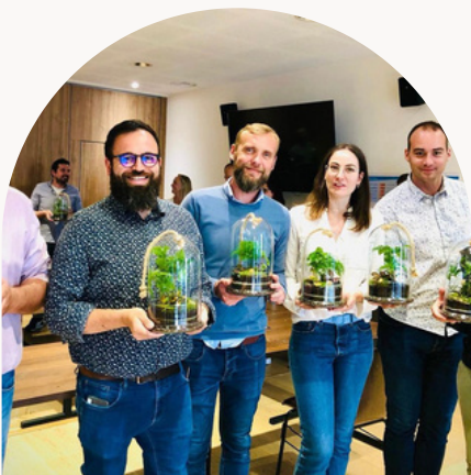
TEAM CULTURA DIRECTEUR DE MAGASIN

QU'EST CE QU'A APPORTÉ CET ATELIER DANS VOTRE JOURNÉE D'ÉQUIPE ?