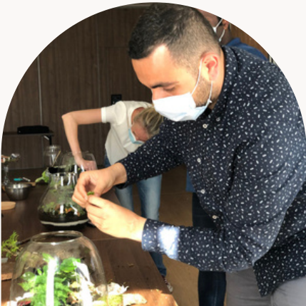
TEAM CHANEL - ÉQUIPE LOGISTIQUE

LA TOUCHE QUE VOUS PRÉFÉREZ DE VOTRE TERRARIUM?